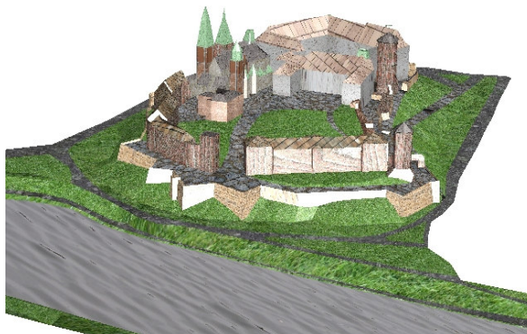
Rys. 2. Wirtualny model 3D Wzgórza Wawelskiego z zakolem Wisły

Do pierwszej wizualizacji wykorzystano model Wzgórza Wawelskiego z zakolem Wisły w Krakowie (Olczyk, 2006), pozyskany ze stereoskopowego pomiaru zdjęć lotniczych w skali 1:13 000. W ramach wizualizacji wykonanej w programie MicroStation V8 dodano do modelu powierzchniowego tekstury pozyskane ze stron internetowych (Tekstury, 2007) oraz ustawiono oświetlenie globalne, które daje efekt naturalnego oświetlenia (podano współrzędne terenowe dla oświetlanego miejsca: 50°N i 20°E, datę oraz godzinę: 10 września 2007 godz. 9:00), włączono również cienie słoneczne. Tak przygotowaną wizualizację wyeksportowano do standardu VRML. Ponieważ program MicroStation nie posiada możliwości eksportu do standardu X3D, do wygenerowania modelu w tym standardzie wykorzystano program SwirlX3D. Rozmiar plików (Tab 2), zarówno w standardzie VRML jak i X3D, nie spowodował żadnych problemów podczas ich otwierania praktycznie w żadnej przeglądarce. Natomiast problemem, z jakim się spotkano przy tym modelu, był sposób wyświetlania wirtualnej sceny w niektórych przeglądarkach. Na przykład program VrmlView nieprawidłowo wyświetlał tekstury, co spowodowane jest najprawdopodobniej błędnym działaniem programu, gdyż program Virtuvian Studio już takich błędów nie wykazuje (Rys. 2).