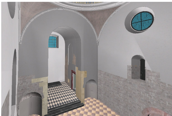
Rys. 3. Wirtualny model 3D wnętrza kościoła Św. Wojciecha w Krakowie

Do drugiej wizualizacji wykorzystano model 3D wnętrza kościoła Św. Wojciecha w Krakowie (Mach, 2005), stworzony na podstawie pomiaru stereoskopowego zdjęć naziemnych w ramach fotogrametrycznej inwentaryzacji. Wizualizacja została wykonana w programie MicroStation V8 i wyeksportowana do standardu VRML. Konwersję do standardu X3D wykonano również w programie SwirlX3D. Niestety duży rozmiar plików (Tab 2) zarówno w standardzie VRML jak i X3D spowodował pewne problemy już przy wyświetlaniu ich w przeglądarkach VR. Część z nich w ogóle nie była w stanie załadować tych plików, inne (np. Virtuvian Studio) wyświetlały prawidłowo wizualizację, lecz rozmiar pliku nie pozwalał na jakiegokolwiek poruszanie się po tej scenie 3D. Z kolei program VrmlView po wczytaniu wizualizacji 3D pozwolił na płynne poruszanie się po scenie 3D, lecz, podobnie jak w przypadku wizualizacji Wzgórza Wawelskiego, wystąpiły problemy z wyświetleniem tekstur (Rys. 3).