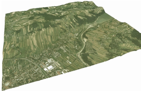
Rys. 4. Numeryczny model terenu wraz z ortofotomapą z okolic Dobczyc (sekcja 1:10 000)

(np. GLView). Pamiętać jednak trzeba o zainstalowaniu dodatkowego zestawu bibliotek obsługujących węzły GeoVRML.