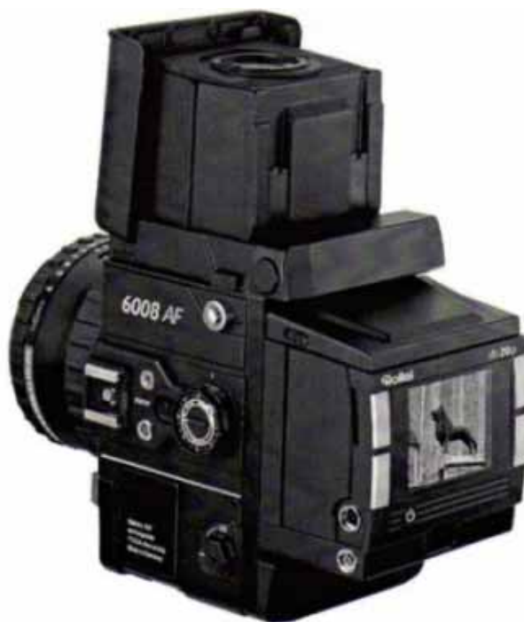
Rys.1. Kamera RolleiMetric 6008 AF z przystawką cyfrową

Kamera RolleiMetric 6008AF (rys.1) jest wyposażona w przystawkę cyfrową o wymiarach matrycy 36.684 \text{ mm} \times 36.72 \text{ mm} , liczbie pikseli 4076 \times 4080 (16.6 mln pikseli) i rozmiarze piksela 9 \text{ }\mu\text{m} . Przy długoogniskowym obiektywie ( f = 80\text{mm} ), stosując „ręczny” pomiar obrazu, z dokładnością 0.33 piksela, można osiągnąć rozdzielczość kątową rzędu 24'' . Zbliżono się zatem do poziomu dokładnościowego standardowego teodolitu klasy Theo 020 (wystarczającego często w przypadku pomiaru punktów niesygnalizowanych). Przy podpikselowej dokładności pomiaru rzędu 0.1 piksela można osiągnąć dokładność precyzyjnego teodolitu klasy Theo 010. Odbywa się to jednak kosztem ograniczonego zasięgu kąowego kamery (tylko 25^\circ ). W sytuacji, gdy możliwy jest dokładny pomiar wysmukłej budowli tylko z niewielkiej odległości, mały zasięg pionowy zmusza do fotografowania i opracowywania wysokiego obiektu częściami. Dlatego przystosowano kamerę do rejestracji zdjęć poziomych i zdjęć nachylonych pod kątem 23^\circ , co daje sensowny zasięg pionowy do 35.5^\circ , przy dwustopniowej „zakładce” obydwu zdjęć. Dla porównania, zasięg górny kamery Photheo 19/1318 to niecałe 26^\circ . W konstrukcji zastosowano libelle o przewodzie 30'' . Autorami proponowanego rozwiązania są: Jerzy Bernasik i Marek Palusiński (projekt rozwiązania mechanicznego). Ostateczną postać nowego fototeodolitu cyfrowego przedstawiają rysunki 2 i 3.