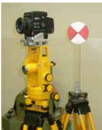
Rys. 3a. Fototeodolit w ustawieniu do zdjęcia poziomego