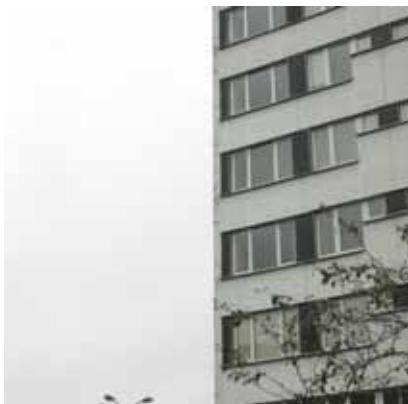
Rys. 4. Zdjęcie nachylone pola testowego

nachylonego; jego funkcję przejął punkt wspólny krawędzi budynku widoczny na obydwu zdjęciach. Jedno ze zdjęć pola testowego ukazuje rysunek 4.