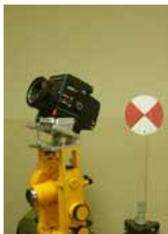
Rys. 3b. Fototeodolit w ustawieniu do zdjęcia nachylonego (widoczny sygnał do zdjęć rektyfikacyjnych)